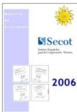
Portada Memoria de Actividades 2006 Disponible en www.secot.org a partir del 7 de Junio.

El día 6 de junio se celebra la Asamblea General Ordinaria de Secot, donde se procede a la renovación de cargos y se somete a la valoración de los socios el balance de las actividades realizadas y los proyectos para el nuevo ejercicio. Entre los datos presentados en la Memoria de 2006 que se presentará a la