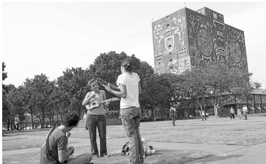
Exterior del edificio de la Universidad Nacional Autónoma de México (UNAM).

La ministra anunció que a finales de 2010 se conocerán los datos de la segunda fase del estudio y «si son positivos» se hará extensivo a todos los centros escolares del país. Jiménez tuvo ocasión de comprobar 'in situ' la aplicación del programa, con un ejemplo de medición antropométrica, para calcular el índice de masa corporal de los alumnos.