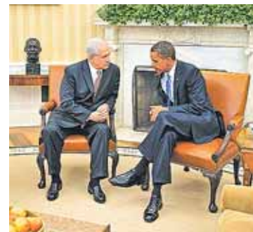
Obama es el anfitrión de las conversaciones.

AGENCIAS/ El primer ministro israelí, Netanyahu, y el presidente de la Autoridad Palestina, Abbas, se reunieron ayer con Barack Obama para reanudar las negociaciones de paz. Israel ya anunció ayer que retomará la construcción de colonias y Palestina reclamó su paralización. Por otro lado, un nuevo ataque palestino en Cisjordania hirió anoche a dos israelíes.