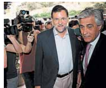
Rajoy encabeza el retiro en Toledo.

REDACCIÓN/ La cúpula del PP, encabezada por Mariano Rajoy, se encerró ayer en el Parador de Toledo para preparar su estrategia política de cara al próximo año y medio, cuando acabe esta legislatura. La crisis económica, los Presupuestos Generales del Estado y las próximas citas electorales serán los temas principales de este retiro.