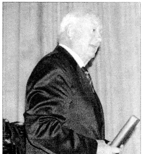
Medio centenar de emprendedores celebraron el décimo aniversario de Secot en Cantabria.