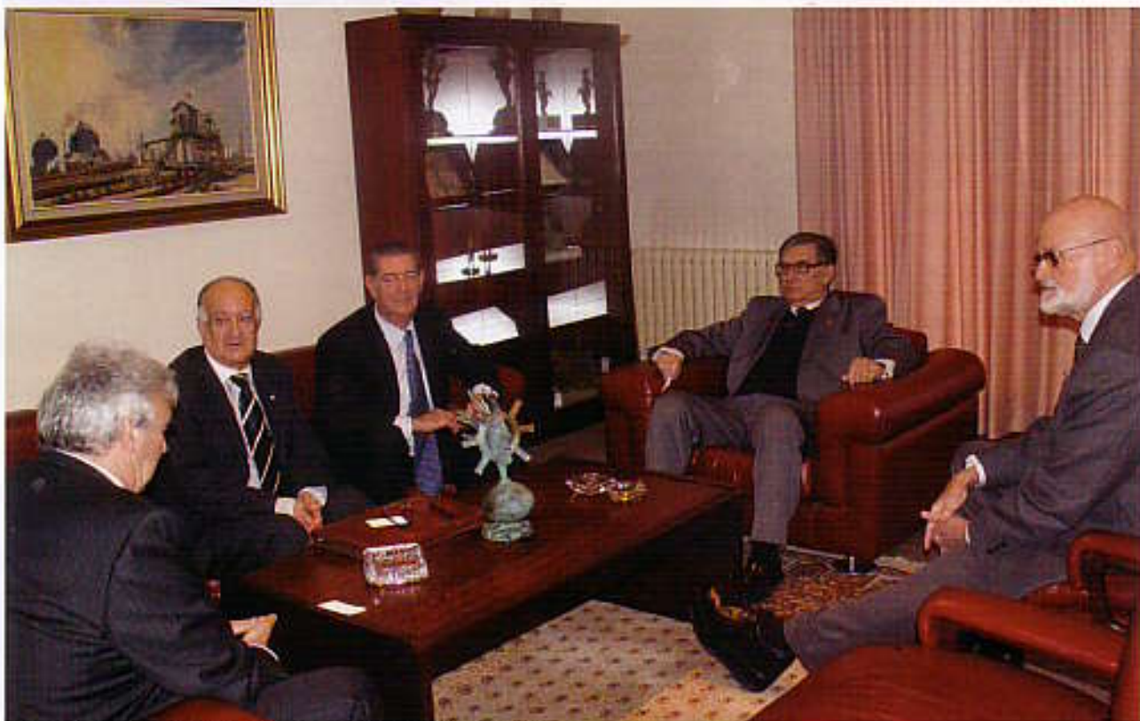
Reunión celebrada en la sede de la Cámara de Comercio de Castellón en febrero de 2010

Entre otras actividades, la Cámara pondrá a disposición de SECOT un despacho y los medios necesarios para la realización de los programas formativos. Ambas entidades elaborarán de mutuo acuerdo la planificación y contenido de los mismos. SECOT aportará el profesorado necesario y cualificado para la impartición de los mismos.