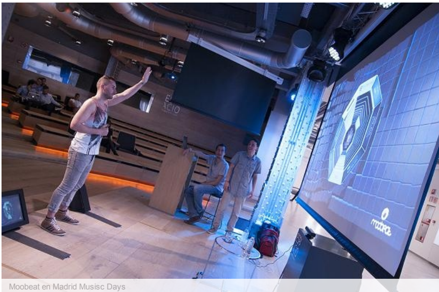
Moobeat en Madrid Music Days

Primero, como a todo el mundo, cuesta entender estas nuevas tecnologías, el por qué más que nada, ¿solo puro entretenimiento, o es una línea de negocio de verdad, o vas a resolver algo? Al fin y al cabo si no resuelves nada es un artilugio sin más, no tiene sentido y cuando le dimos todos el destino de la ayuda social y el estímulo personal es cuando empezamos a darle forma al proyecto.