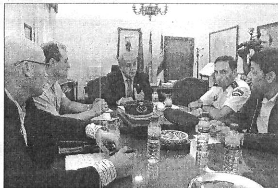
Un momento de la reunión en la Subdelegación

Por ello, reiteró que "no se puede dejar perder" el capital humano de directivos de los sectores agrícolas o industrial de la región para que se sumen a la labor desarrollada por esta organización. □