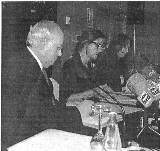
Imagen de la firma del acuerdo de colaboración

La nueva entidad contará con 267 oficinas, 945 empleados, 364.218 clientes y 4.012 millones de activos totales. Según indicó Díaz Zarco ocupará la quinta posición por activos totales medios de todo el grupo de cajas rurales de España y será la segunda caja rural por beneficios, por detrás de la Rural de Navarra. □