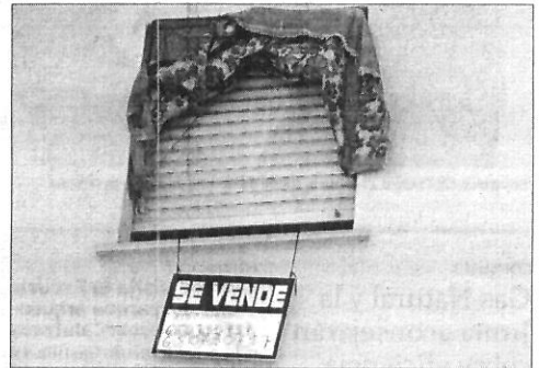
Un cartel anuncia la venta de un inmueble.

Las cajas de ahorro son las entidades que conceden mayor número de préstamos hipotecarios durante julio (52,1 por ciento del total).