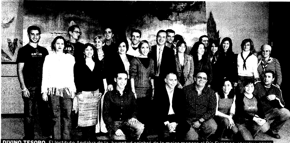
DIVINO TESORO. El Instituto Andaluz de la Juventud celebró de la mejor manera el Día Europeo.