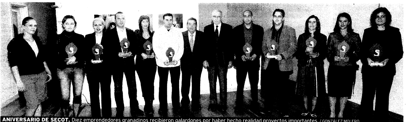
ANIVERSARIO DE SECOT. Diez emprendedores granadinos recibieron galardones por haber hecho realidad proyectos importantes.