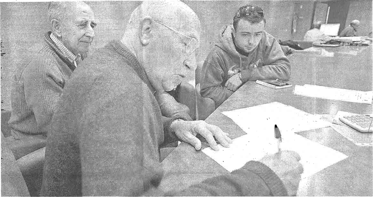
Dos miembros de SECOT asesoran a uno de los jóvenes que acude a la sede de la Cámara de Comercio.

Los miembros de Séniors Españoles para la Cooperación (SECOT) en Valladolid ayudan a los emprendedores a poner en marcha un negocio