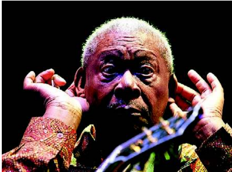
BB King da conciertos, con gran vitalidad, a los 84 años.