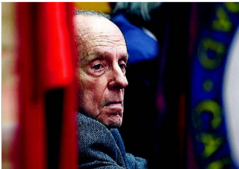
Manuel Fraga, a sus 87, cumple con sus tareas como senador.

sada encarnó a Franco en una telemovie de Antena 3. Asunción Balaguer, la viuda de Paco Rabal, ha celebrado este otoño su 83 cumpleaños subida al escenario del teatro Marquina de Madrid, donde está representando El pisito . Un año más tiene María Asquerino, a quien pudimos ver la pasada primavera en la película Paga-fantas . Y si no trabaja más es porque, según la propia actriz se ha quejado amargamente en varias ocasiones, "a cierta edad ya no te llaman" .