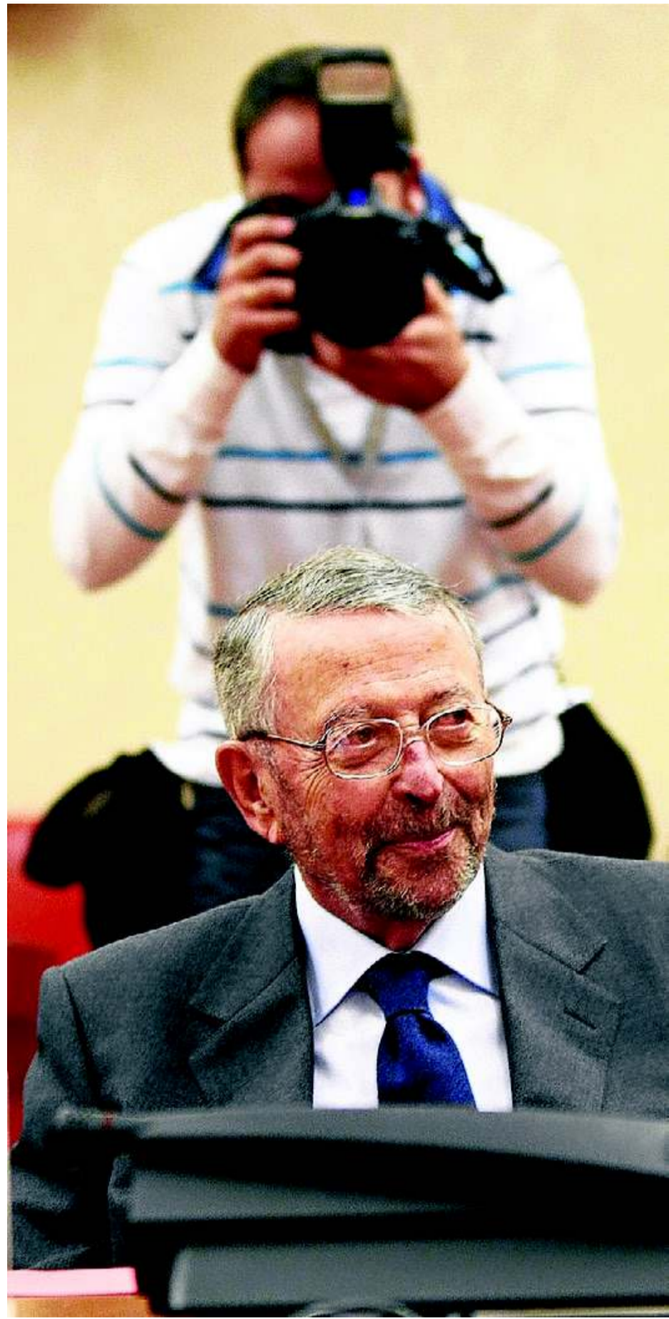
Oliart (81) se estrenó con fuerza ante el Congreso de los Diputados.

que pusiera a la venta su último libro, Guapo y sus isótopos , donde vuelve a mostrar su verbo ágil y su claridad de ideas a la hora de diseccionar la sociedad en clave lingüística. José Saramago, de 87 años, publicó este verano su última novela, Caín , aunque no es difícil encontrarlo a lo largo del año dando conferencias por el país, o apoyando causas sociales con manifiestos y discursos.