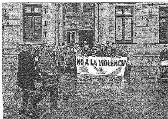
No a la violencia de género.- El Ayuntamiento celebró ayer una concentración silenciosa para rechazar las cinco nuevas muertes por violencia de género que se produjeron el pasado mes.

El Área de Medi Ambiente ha organizado para este jueves, en la Cambra, una jornada en la que se explicará a las empresas cómo afectará el nuevo reglamento de registro y autorización de las sustancias químicas, que afecta a procesos tan variados como la fabricación, el uso, la comercialización o importación de estas sustancias. El reglamento REACH entró en vigor el 1 de junio y ha sido impulsado por la Unión Europea.